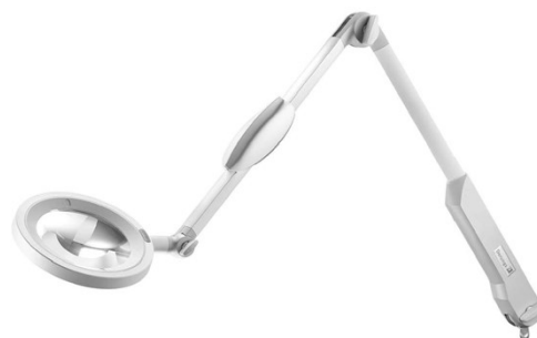
Version pin pour différents systèmes de fixation