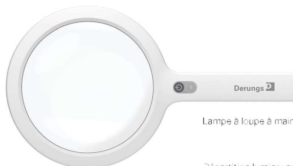
Lampe à loupe à main